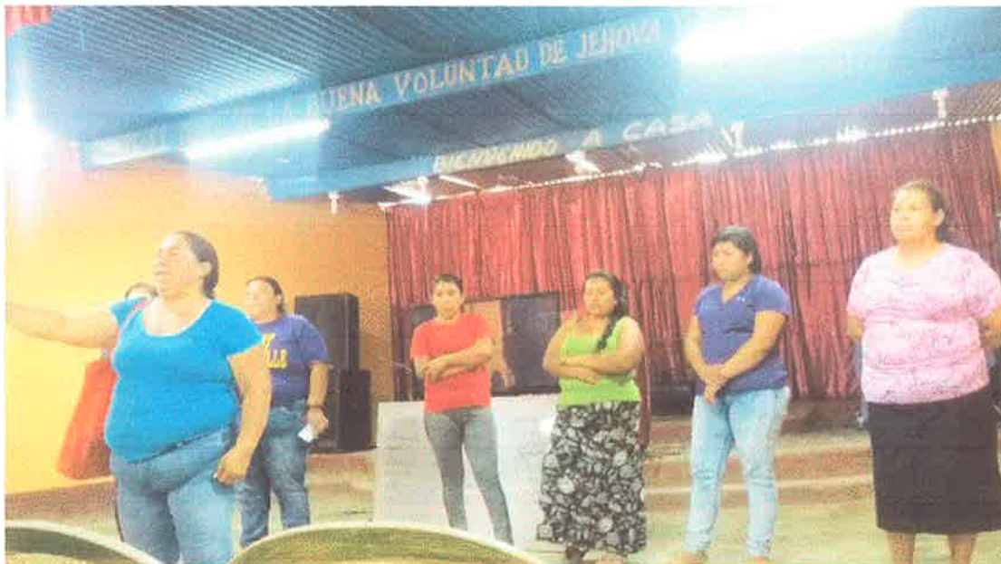
Imagen 6. Título: Socialización de resultados del proyecto.

Para concluir, el COCODE realizó un acta donde quedó establecido realizar gestiones institucionales para realizar un estudio topográfico y un estudio de riesgo a la comunidad, por lo que el primer acercamiento sería con CONRED. Todos los presentes en la asamblea firmaron el acta en señal de compromiso y apoyo al Consejo Comunitario de Desarrollo.