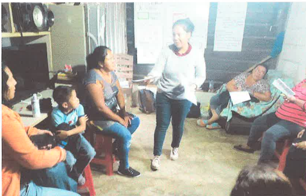
Imagen 1. Título: Formación de la Ley de Consejos Comunitarios.