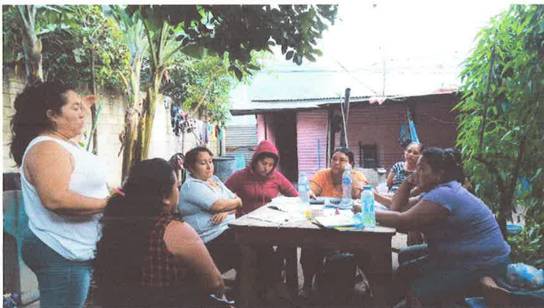
Imagen 2. Título: Formación del Código Municipal.

También se enfatizó en la importancia de su participación como lideresas comunitarias en las asambleas municipales para la propuesta y apoyo a proyectos e iniciativas que beneficien a su comunidad. Para concluir, se realizó una evaluación participativa dirigida y orientada por la estudiante en EPS, donde cada participante vinculó un artículo de la ley con su contexto social actual y el ejercicio de sus funciones como COCODE.