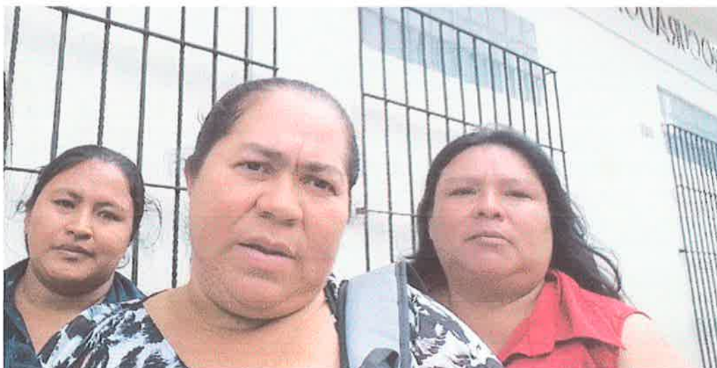
Imagen 4. Título: Visita a la Procuraduría de Derechos Humanos –PDH- zona 1.

Para reivindicar las emociones de las lideresas y mediando la situación, se incentivó a las integrantes a buscar estrategias y continuar en la lucha por el derecho a una vivienda digna; a pesar de la decepción, se comprometieron a analizar la situación y formular propuestas que manifestarían en la próxima actividad de capacitación y acompañamiento.