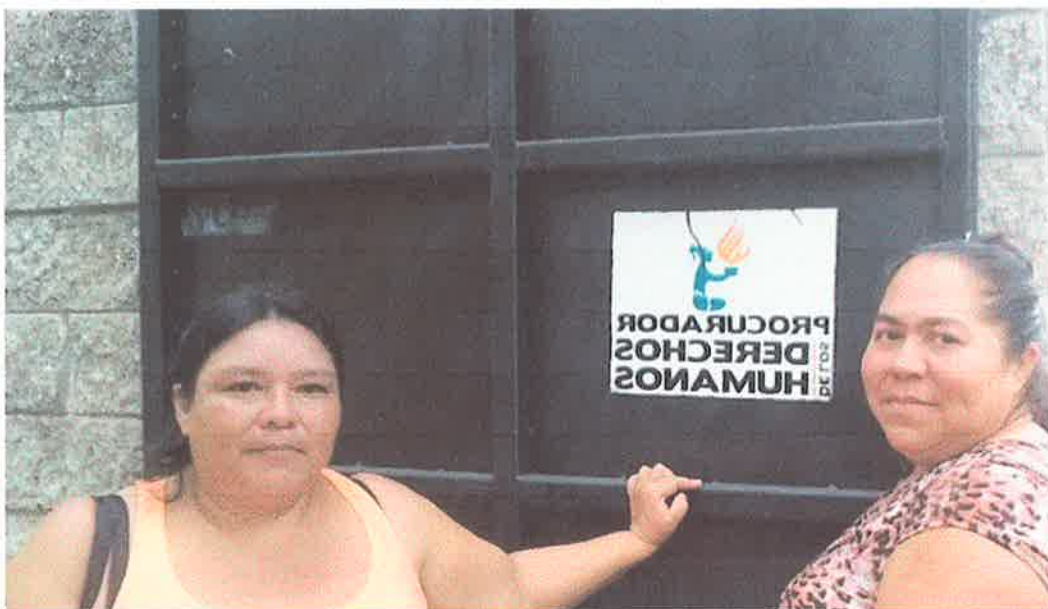
Imagen 3. Título: Visita a la sede de la Procuraduría de Derechos Humanos de Escuintla.