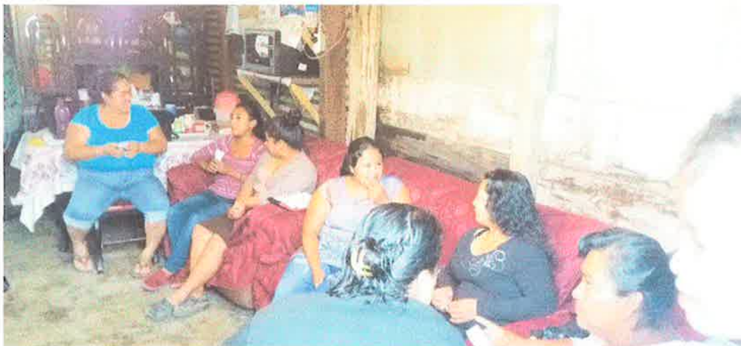
Imagen 5. Título: Socialización de logros, limitantes y compromisos.