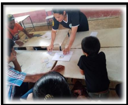
Imagen 1 Actividad de rompecabezas. Aguilar, R., 2019.

Se dio a conocer a los coordinadores del COCODE las actividades que se trabajarían en la semana con la niñez, se estableció fecha y hora para el siguiente taller.