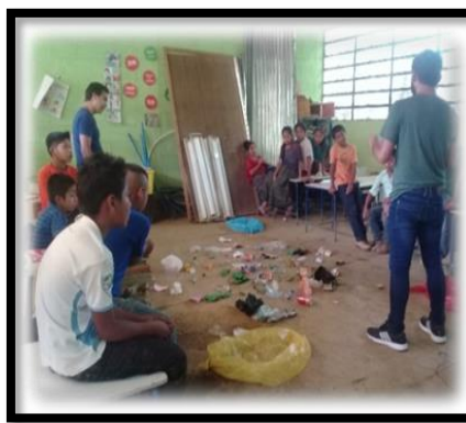
Imagen 4 Realización de dinámicas. Aguilar, R., 2019.