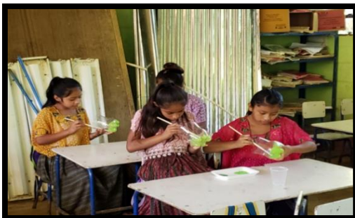
Imagen 5 Taller de manualidades. Aguilar, R., 2019.