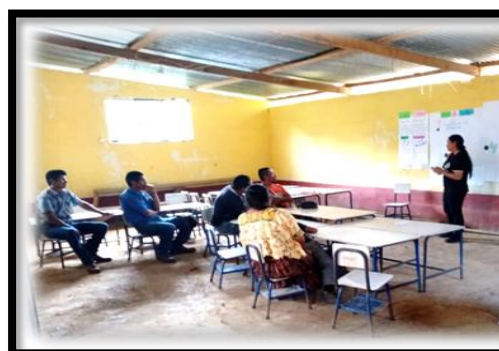
Imagen 2 Explicación del tema. Aguilar, R., 2019.