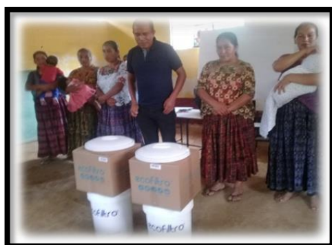
Imagen 8 Donación de ecofiltros. Aguilar, R., 2019.

Para finalizar se firmó la documentación requerida por la empresa y se despidieron a los participantes.