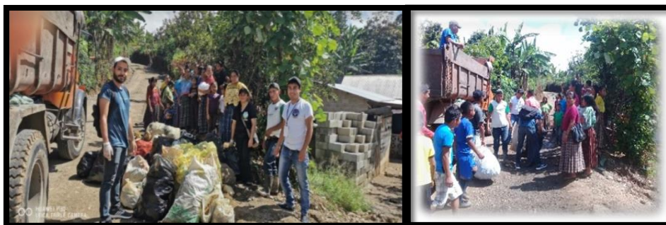
Imagen 10 Participación en la jornada de recolección de desechos sólidos. Aguilar, R., 2019.

Al realizar el retorno con el camión de la basura se recolectaron más bolsas de basura de comunidades aledañas que al ver el camión se organizaron para realizar la limpieza en sus áreas comunes.