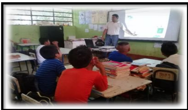
Imagen 3 Exposición del tema por personal del MARN. Aguilar, R., 2019.

Al concluir la actividad se le entregó a cada niño una bolsa de caramelos y un afiche sobre el manejo de los desechos sólidos. Posteriormente al trabajo con los niños, se conversó con el director de la escuela y se calendarizó la entrega de los ecofiltros para lo cual debía convocar a los padres de familia del alumnado y al representante de la organización de padres de familia. Para cumplir con los requerimientos de la donación. Al finalizar la jornada, se obtuvo el apoyo del Ministerio de Ambiente para el desarrollo del taller y la prestación de los materiales que se utilizaron; asimismo, se contó con la disponibilidad del centro educativo y la participación activa de los niños.