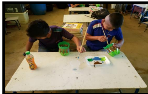
Imagen 6 Taller de manualidades. Aguilar, R., 2019.