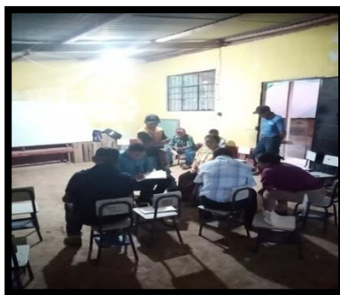
Imagen 11 Reunión sobre área recreativa Aguilar, R., 2019

Se dejó como acuerdo que al tener una respuesta concreta contactarían a la estudiante de Trabajo Social para informarle y coordinar las acciones necesarias.