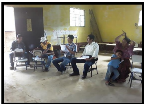
Imagen 7 Taller con COCODE Santo Tomás II Aguilar, R., 2019.

establecer otra problemática a la que quisiera dar respuesta de forma organizada.