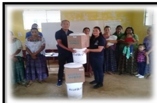
Imagen 9 Entrega simbólica de ecofiltros. Aguilar, R., 2019.